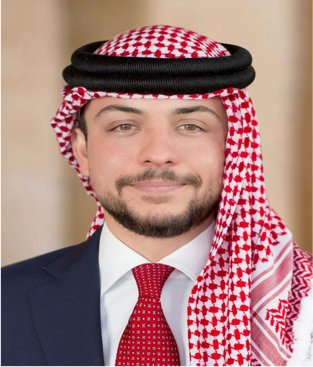
صاحب السمو الملكي الأمير الحسين بن عبدالله الثاني ولي العهد