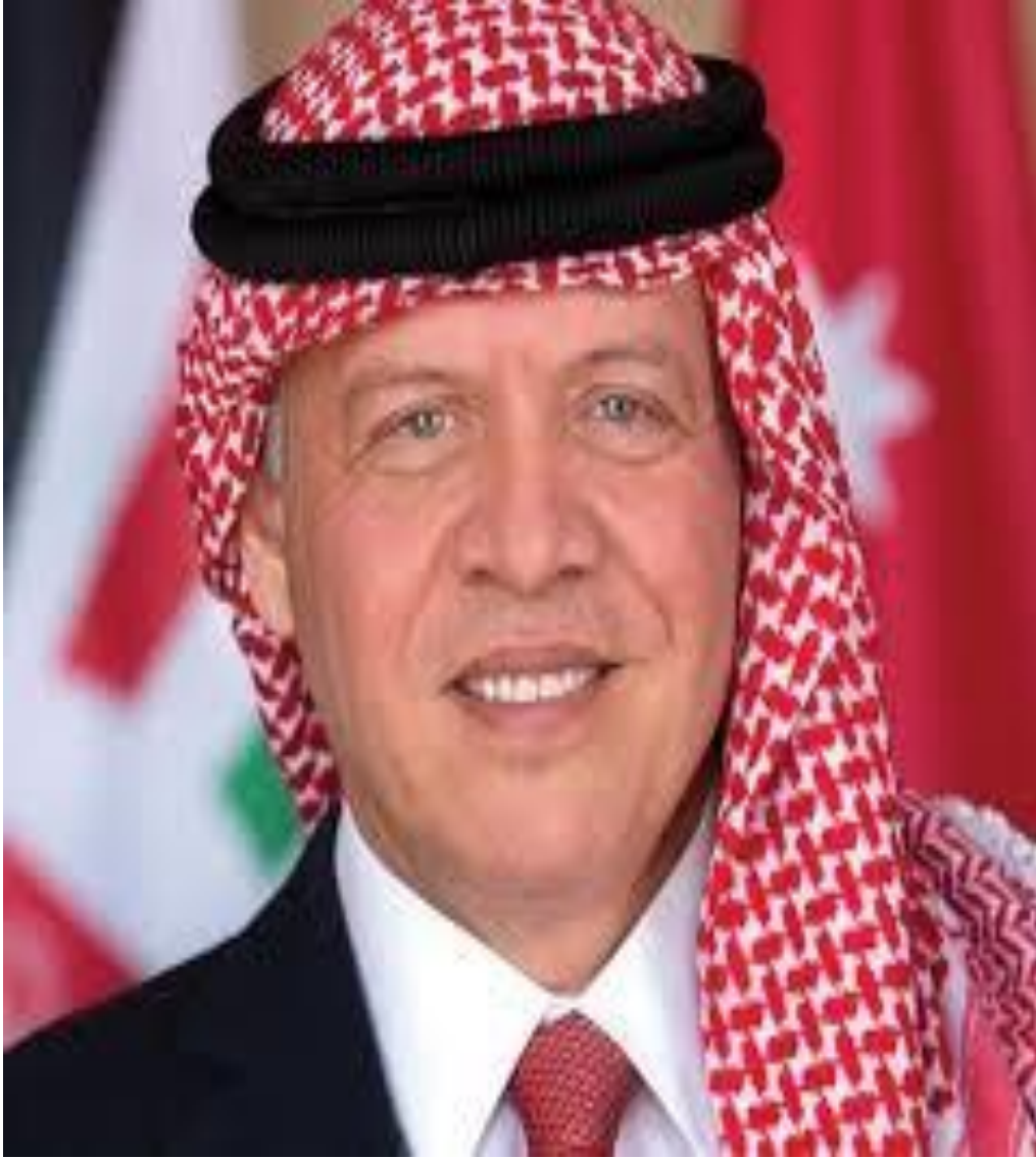
جلالة الملك عبد الله الثاني ابن الحسين المعظم حفظه الله ورعاه